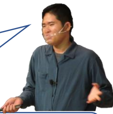
長崎外国語大学/日本

Q, 기획위원은 어떤 일을 하시지요? A, GP는운동회나 프레젠테이션 대회, 카페토크 등등 여러가지 이벤트를 하고 있습니다. 기획운영위원은 개최되는 이벤트를 다같이 협력해서 기획과 운영을하고 있습니다. 저희와 함께 기획하는 즐거움을 느껴봅시다!