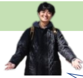
長崎総合科学大学/日本

Q, 어떤학생이 참가하나요? A, 나가사키현내의 대학생! 대학의 테두리를 넘어서 활약하고 있습니다. 다양한 국적의 유학생들과 타대학의 학생들과도 교류합니다. 중국/동남아시아의 유학생은 물론 많은 나라의 유학생들이 참가하고 있습니다.