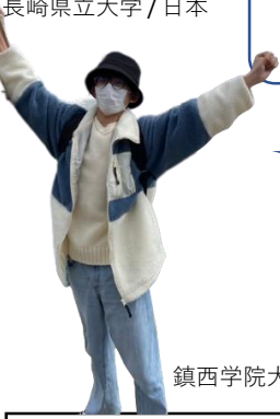
長崎県立大学/日本

Q, 기획위원은 어떤 일을 하시지요? A, GP는운동회나 프레젠테이션 대회, 카페토크 등등 여러가지 이벤트를 하고 있습니다. 기획운영위원은 개최되는 이벤트를 다같이 협력해서 기획과 운영을하고 있습니다. 저희와 함께 기획하는 즐거움을 느껴봅시다!