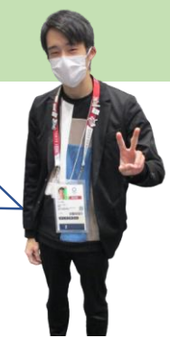
長崎外国語大学/日本

Q, 어떤학생이 참가하나요? A, 나가사키현내의 대학생! 대학의 테두리를 넘어서 활약하고 있습니다. 다양한 국적의 유학생들과 타대학의 학생들과도 교류합니다. 중국/동남아시아의 유학생은 물론 많은 나라의 유학생들이 참가하고 있습니다.